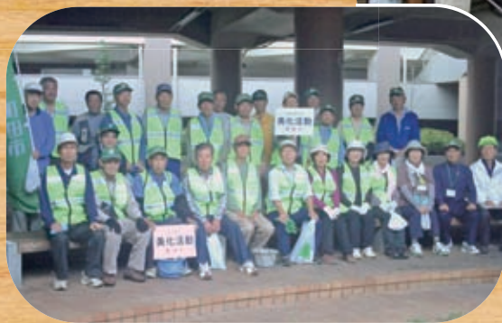
多 摩 境